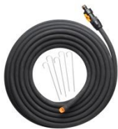
Wąż nawadniający ok. 192 zł

Zdjęcia produktowe i orientacyjne ceny detaliczne: